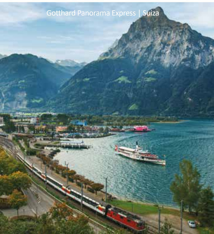
Gotthard Panorama Express | Suiza

11 Lucerna - Zúrich Llegada por cuenta propia a la estación de tren de Lucerna para tomar su tren a Zúrich. Su viaje termina en la estación de tren o en el aeropuerto de Zúrich.